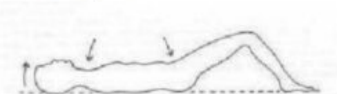
Inspiração – movimento da pelve para trás